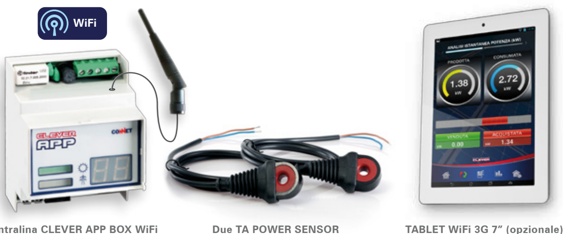
centralina CLEVER APP BOX WiFi

Se si desidera monitorare il proprio impianto fotovoltaico o gestire i consumi delle proprie utenze da remoto, sarà sufficiente impostare tramite il Tablet i parametri della rete WiFi di casa. Cliccando sull'icona CLEVER APP il Tablet si collegherà direttamente anche da fuori casa all'apparato di monitoraggio senza dover sostenere alcun costo di servizio.